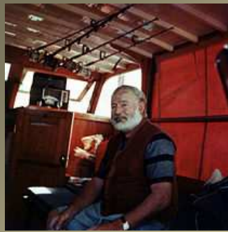
Ernest Hemingway (1899 - 1961)

În cele din urmă, bătrânul reușește să „păcălească” frumosul pește spadă, capturându-l. De fapt, nu este păcălit, ci absolutul se lasă capturat și confiscat temporal de om, se "jertfește" tocmai pentru a proba caracterul său intangibil. Prin aceasta, romanul atestă, o dată în plus, caracterul său inițiativ. Lupta prin care pește spadă este învins și însângerat reprezintă de fapt lupta oricărui om de a avea acces la adevăr. Numai că se întâmplă faptul că acesta nu poate fi comunicat celorlalți. Cunoașterea este o aventură periculoasă și incomunicabilă. Fiecare trebuie să trăiască pe propria-i piele înfruntarea riscantă cu marea. Pentru a avea acces la cunoaștere, omul trebuie să își asume eventualitatea suferinței și a căutărilor: "Cât de mult ai suferit? (...) Din belșug" (pag. 172).