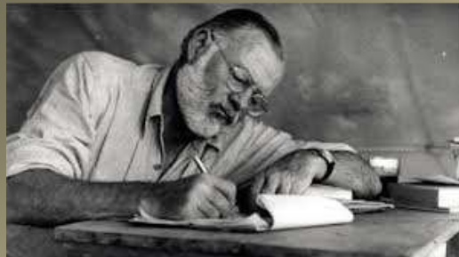
Ernest Hemingway scriind